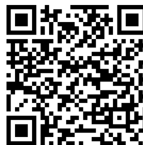
Google Play Store

Um das Gerät mit der Casambi-App verwenden und parametrieren zu können, muss es einem Netzwerk hinzugefügt werden.